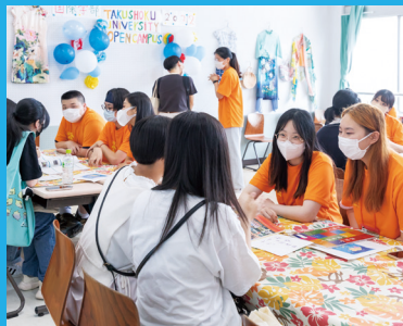
オープンキャンパスの個別相談を通じて入学の意志を固めたという学生も少なくありません。

総合型選抜は本学の理念や特色を理解した上で、明確な学ぶ意志を持った学生を募集する試験です。オープンキャンパスに参加して、本学への理解を深めることはもちろん、志望動機などを考える上でも大いに役立つはず。また、本学の教職員と話すことで予行演習ができ、場馴れすることもできるのでぜひご参加ください。